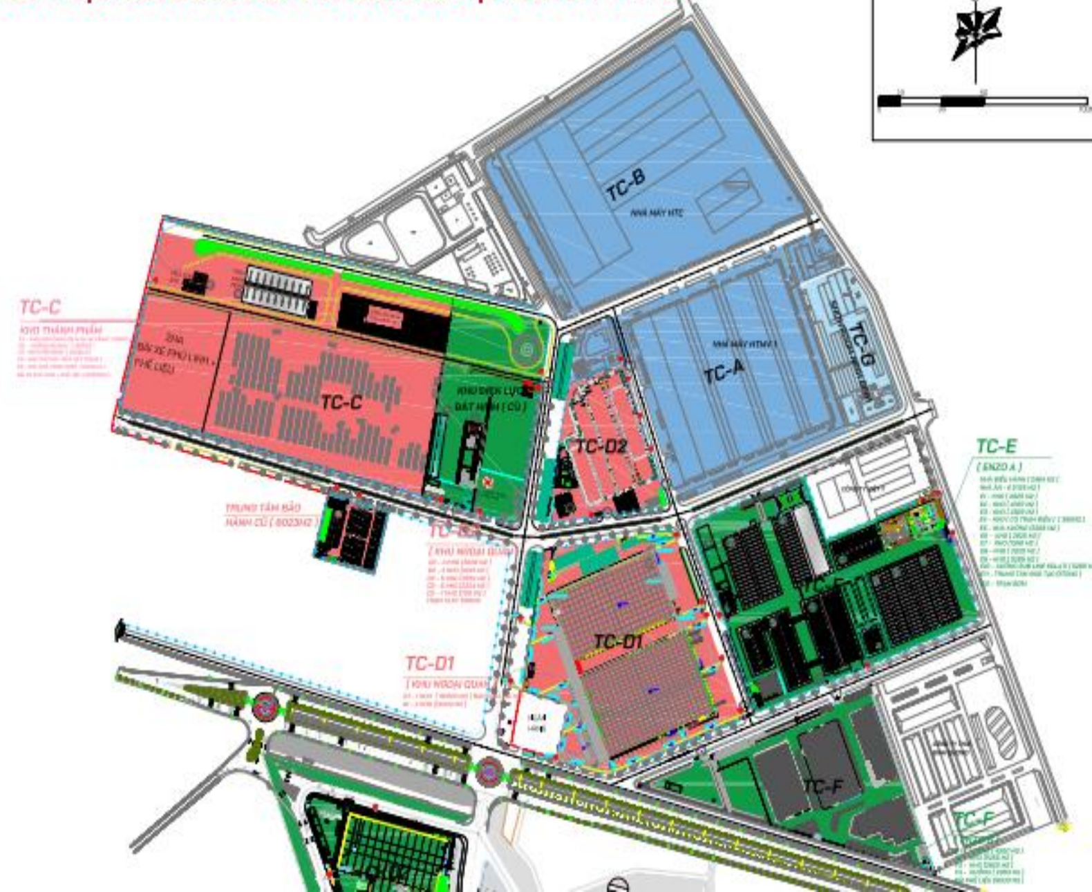
TỔNG MẶT BẰNG CÁC KHU ĐẤT CỦA TCG TẠI KCN - GIÁN KHẨU